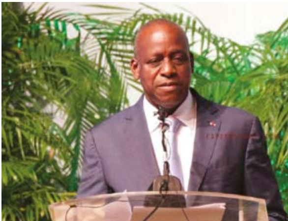
Le ministre Ally Coulibaly, lors de son discours

2015, 2017, 2019, nous voici à la 3 ème édition de notre forum de la diaspora, notre biennale de rencontres et d'échanges qui commence à gagner sa place dans l'agenda national et international, au nombre des espaces de libre discussion, où on peut débattre sans tabou aucun et échanger, débarrassé de tout prêt à penser.