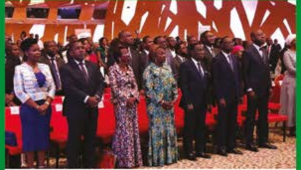
Solidarité gouvernementale autour de la 3 ème édition du forum de la diaspora