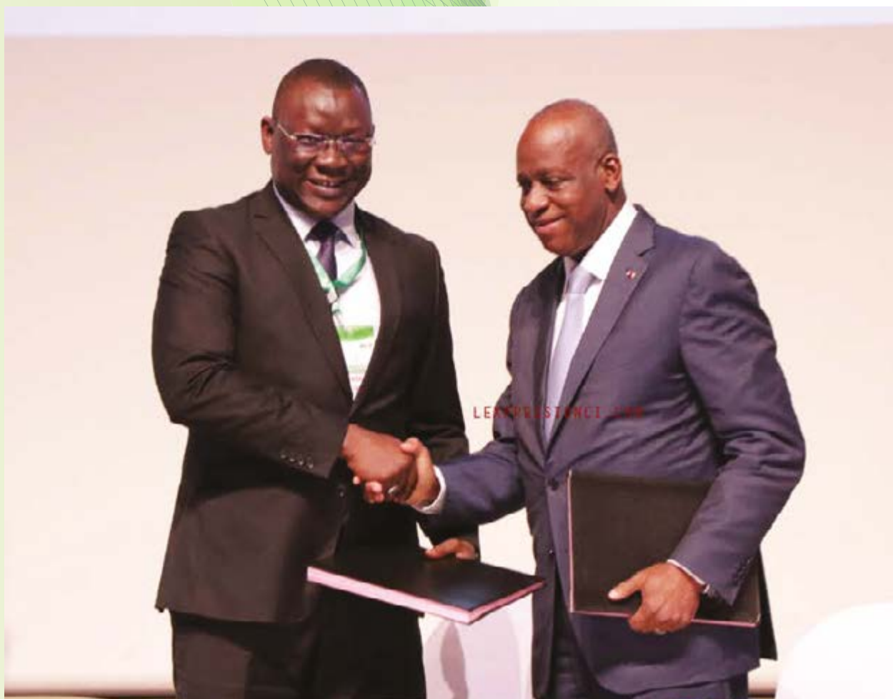
Signature de convention entre l'État de Côte d'Ivoire et le Fonds de Solidarité Africain (FSA)

Dans sa volonté d'accompagner les initiatives entrepreneuriales de la diaspora ivoirienne, l'État de Côte d'Ivoire a procédé à la signature d'une convention de coopération avec le Fonds de Solidarité Africain (FSA), le 15 juillet 2019 au cours de la cérémonie d'ouverture du 3 ème forum de la diaspora ivoirienne.