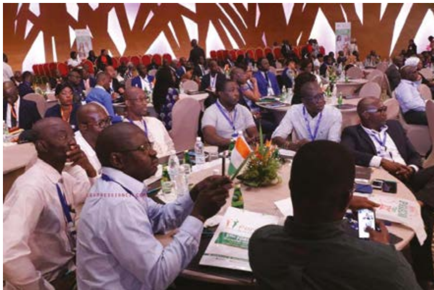
Une vue des participants lors de la cérémonie d'ouverture

on a enregistré certains de ses représentants au Gouvernement, au Sénat et au Conseil économique, social, environnemental et culturel. D'autres Ivoiriens de la diaspora sont à la tête de certaines entreprises publiques, de certains conseils municipaux, de certains conseils régionaux et dans certains cabinets ministériels ainsi que dans l'administration centrale. Certaines de ces compétences ont été recrutées soit par voie de concours soit par appel à candidature.