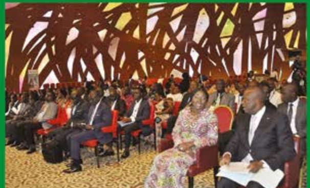
Les ministres Kandia Camara et Ally Coulibaly lors de la cérémonie de clôture

Ministère de l'Intégration africaine et des Ivoiriens de l'extérieur Abidjan-Plateau Cité Administrative, Tour C 22 ème étage Adresse : 01 BPV 225 Abidjan 01 - Tél : 20 33 12 12 / Mobile 72 46 37 29 Email : mupia.ci5@gmail.com / Fb : mupia miaie