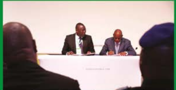
Signature de convention entre l'État de Côte d'Ivoire et le Fonds de Solidarité Africain pour soutenir les projets de la diaspora