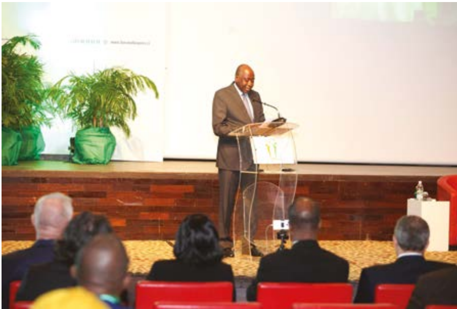
Le Premier ministre, Amadou Gon COULIBALY, lors de son discours

C'est avec un plaisir renouvelé, que je me retrouve cette année encore parmi vous à l'occasion de la 3 ème édition du forum de la diaspora organisé par le Ministère de l'Intégration africaine et des Ivoiriens de l'extérieur. Je voudrais saluer le médiateur de la République et les membres du gouvernement qui honorent de leur présence cette cérémonie. Comme l'a indiqué tout à l'heure le Ministre de l'Intégration africaine et des Ivoiriens de l'extérieur, la présence des membres du gouvernement aussi massive indique que le gouvernement a décidé de saisir cette question qui est véritablement transversale.