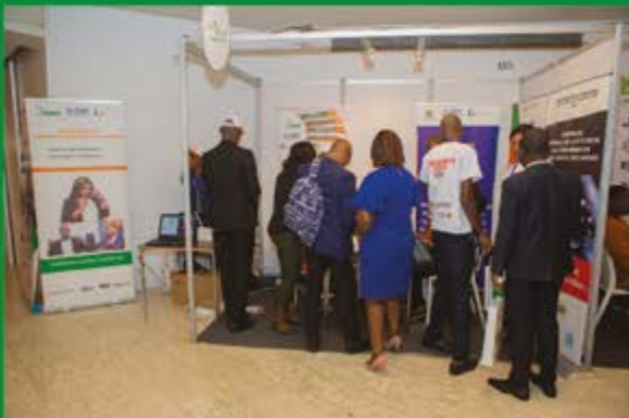
Stand Emploi Jeunes